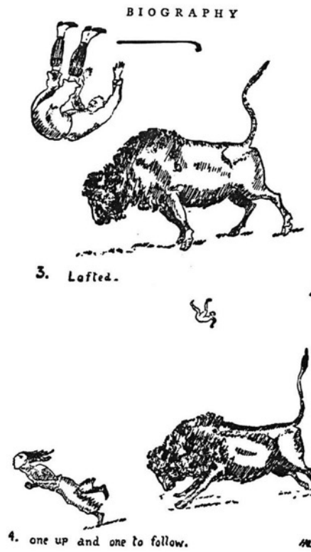
Figura 1. Biography of Saki . Ethel Munro (23)