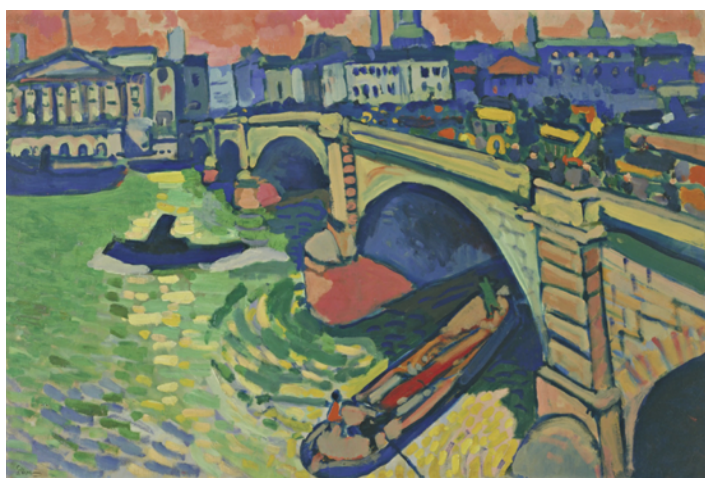
Figura 3. London Bridge . André Derain. 1906. Óleo sobre tela. (66 x 99.1 cm).

mundo cargado de esa pretenciosa urbanidad encargada de ocultar los defectos de la civilización industrial. La nostalgia de un pasado asentado en lo rural, lo pagano y lo animal era su única convicción ideológica. « Saki shows nostalgia for the old pastoral landscape of England, an environment unspoiled by industrial changes (...) Saki was not pleased with his contemporary world » (Elahipanah 172).