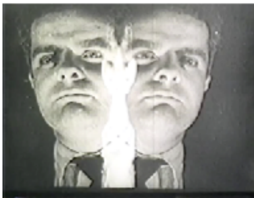
Werner Graeff en Vormittagsspuk

Werner Graeff fue una de las fuerzas conductoras detrás de la realización de Vormittagsspuk . IMDB lo reconoce también como el co-escritor del guión de la película. Incluso se lo ve en varias de sus tomas.